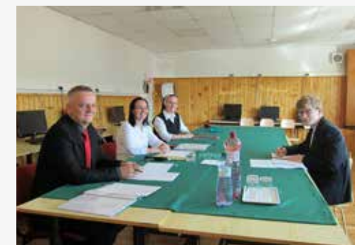
Tak aspoň pre nás spomienková foto z našich maturít.

A tie dva roky hádam každý z nás zvládne. (A ak by náhodou ešte niekto niekedy maturoval z latinčiny na GSF, tak aj my zavoláme do telky, nech aj o nás vedia.)