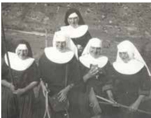
Práca pri sene.