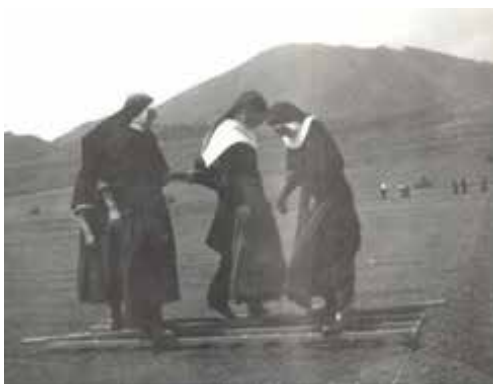
Práca pre štátne lesy.